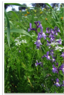
Linaria Ricardoi Coutinho

A Linaria Ricardoi Coutinho é uma planta anual, que floresce em Março e Abril, que ocorre preferencialmente em searas de trigo e de aveia com baixa intervenção humana, ou em terrenos de olival e de montado. Trata-se de um endemismo lusitano muito raro e localizado no Distrito de Beja, mais propriamente no concelho de Cuba e Alvitto, e é considerado prioritária no âmbito da Rede Natura 2000. Esta rede ecológica do Espaço Comunitário tem como objectivo contribuir para assegurar a biodiversidade através da conservação dos habitats naturais e da fauna e da flora selvagens. Os dois núcleos populacionais actualmente conhecidos incluem usualmente algumas centenas de exemplares, pelo que, à luz do conhecimento actual sobre a espécie, esta encontra-se em perigo de extinção. O uso de herbicidas, resultado da intensificação agrícola, e a prática da pastorícia, contribuiu de forma decisiva para um decréscimo populacional acentuado.