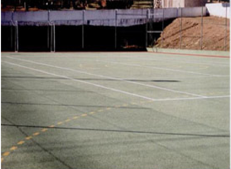
Estreito (An) e o equipamento (pública) de futebol de 11, cantale, patim, e béquei em Faro do Alentejo Faro do Alentejo Campo de Futebol 11