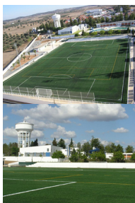
Junto à Estrada da Circulação

Iluminação artificial, balneários de visitante e visitado, bem como da equipa de arbitragem, lavandaria e arrecadação. Foram colocadas novas Bancada. Piscinas Descobertas