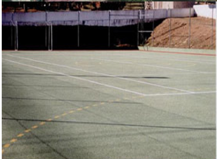
Palmeira (Ans) e Gil Vicente (Campor) (pó de sintético de futebol 5, cantaleiro, patim, esteira, béquei em Faro do Alentejo Campo de Futebol 11