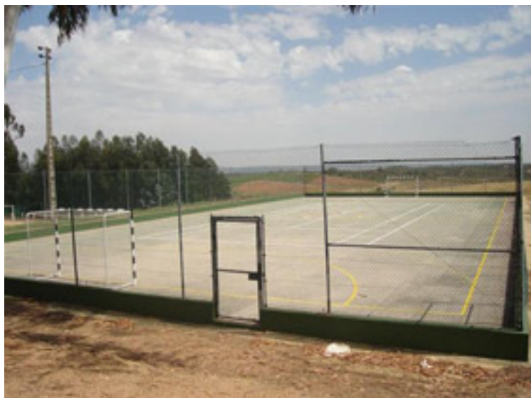
Vila Ruiva Campo de Futebol 11