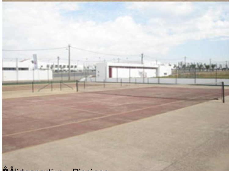
Álidesportivo - Piscinas