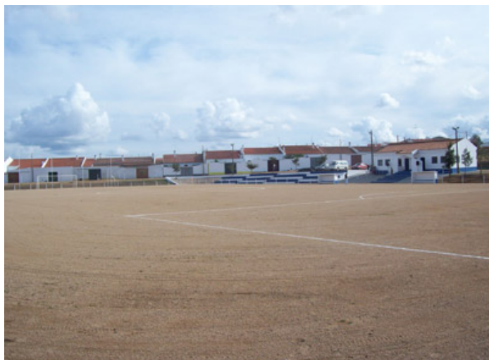
6. Cam. Campo Desportivo e Pátio de Futebol 5, 11 do Alentejo, com uma equipa de futebol de 1ª e 2ª divisão