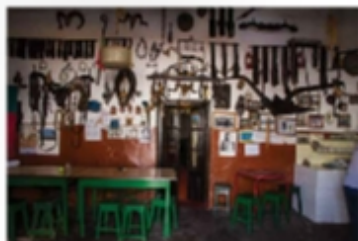
Interior da taberna de Cuba, com a barra de madeira e as cadeiras de plástico.

Cuba é uma vila pequena, com cerca de 100 habitantes, mas é conhecida por ser o berço do vinho de talha e do cante alentejano. A taberna de Cuba é um dos mais antigos e tradicionais locais de convívio da região. O espaço é simples, com uma barra de madeira e algumas cadeiras de plástico. O ambiente é acolhedor e os clientes são tratados com carinho. A taberna é conhecida por ser o local onde se pode encontrar o melhor vinho de talha da região. O espaço é simples, com uma barra de madeira e algumas cadeiras de plástico. O ambiente é acolhedor e os clientes são tratados com carinho. A taberna é conhecida por ser o local onde se pode encontrar o melhor vinho de talha da região.