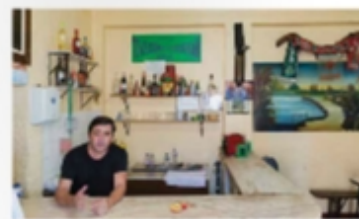
Interior da taberna de Cuba, com a barra de madeira e as cadeiras de plástico.

Cuba é uma vila pequena, com cerca de 100 habitantes, mas é conhecida por ser o berço do vinho de talha e do cante alentejano. A taberna de Cuba é um dos mais antigos e tradicionais locais de convívio da região. O espaço é simples, com uma barra de madeira e algumas cadeiras de plástico. O ambiente é acolhedor e os clientes são tratados com carinho. A taberna é conhecida por ser o local onde se pode encontrar o melhor vinho de talha da região.